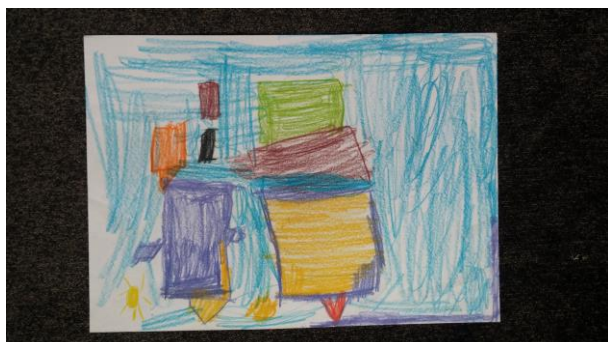
"Osiedla" Paweł Musiał