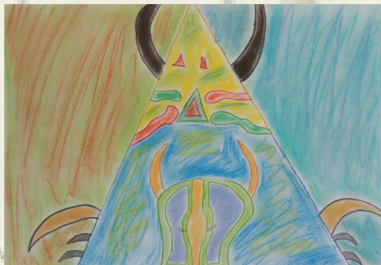
praca pt. „Dom-wigwam” autor: uczeń ZSS14 Kuba Czekaj

W ROKU SZKOLNYM 2017/18 W ZESPOLE SZKÓŁ SPECJALNYCH NR 14 W KRAKOWIE powstał pomysł na realizację projektu „Jestem artystą!” mającego na celu przeciwdziałanie wykluczeniu osób niepełnosprawnych intelektualnie . Zaistniał on w oparciu o przekonanie, że w sztuce nie ma barier i tworzyć może absolutnie każdy.